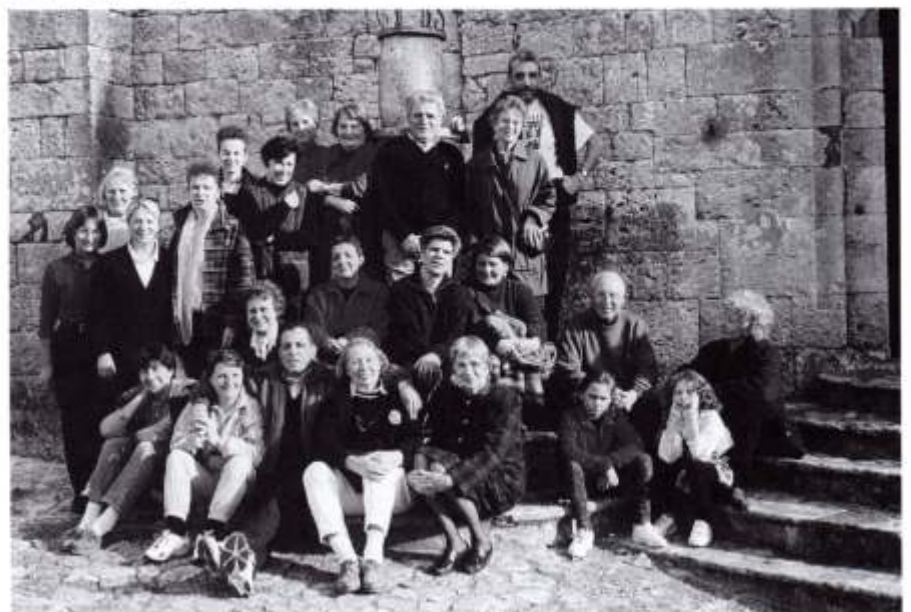
Photo de famille devant l'église de Cologne