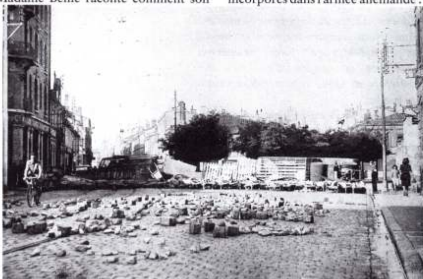
La barricade place Roquelaine

* soviétiques anti-communistes incorporés dans l'armée allemande .