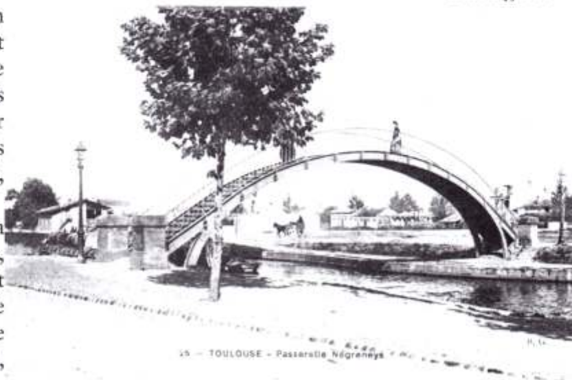
25 - TOULOUSE - Passerelle Négrenéys