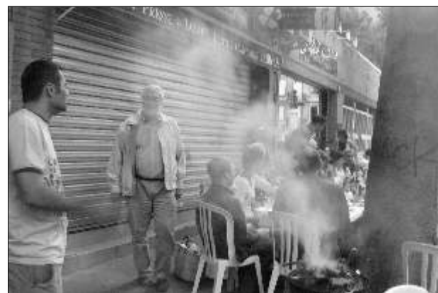
Quelques barbecues aiguisent les appétits