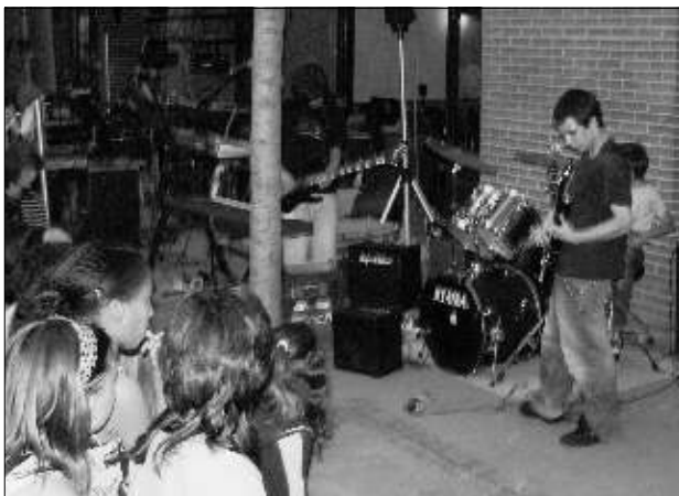
The Rodents : la valeur n'attend pas ...