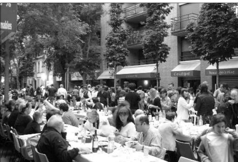
Moins chaud cette année mais tout aussi chaleureux.