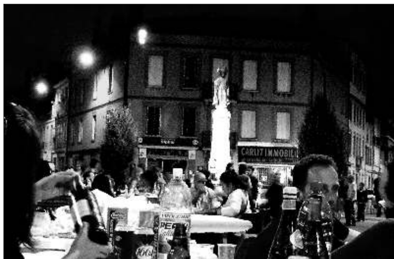
Quand la fontaine est vide, on bavarde tranquillement sans risquer la douche