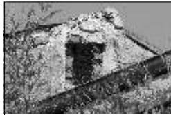
Sans nécessiter de démarche officielle, des travaux, même peu visibles, devraient être correctement réalisés

et les autorisations sont données ou non en fonction des règles en vigueur (PLU). Simplification également au stade de l'achèvement des travaux, qui ne sera plus validé par un certificat de conformité mais par une déclaration du constructeur ou de l'architecte qui en restera responsable. A