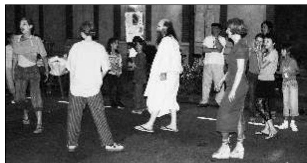
Le groupe du théâtre du quartier a dû donner de la voix