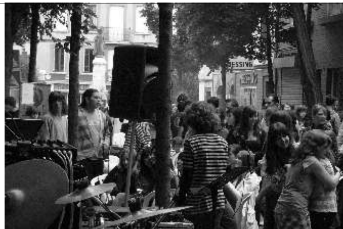
et les groupies ne manquent pas !