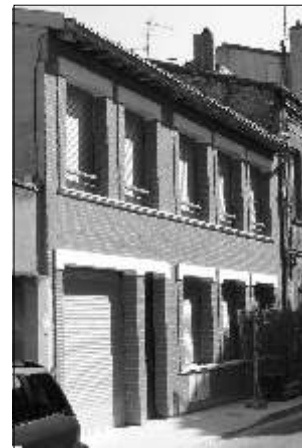
Heureusement, il existe aussi des travaux qui se terminent bien et des façades bien finies

Pour une information complète, le lecteur se reportera au site du Ministère de l'Équipement http://www.urbanisme.equipement.gouv.fr/IMG/pdf/ref_orme-_ads_cle62612f.pdf