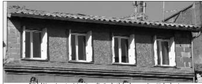
Déjà habitée, mais pas terminée, cette surélévation dont la façade -composite- a été abandonnée garnie de quelques briques de parement qu'il semble difficile de faire tenir sur de l'agglomération de bois

L'association du quartier, soucieuse de préserver la qualité de vie du quartier, espère