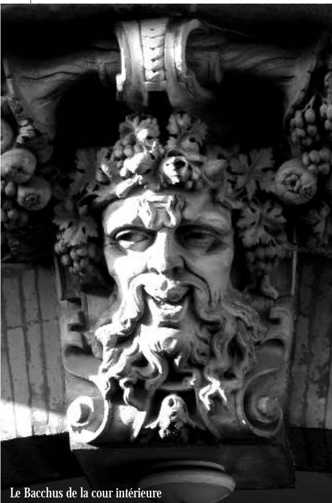
Le Bacchus de la cour intérieure