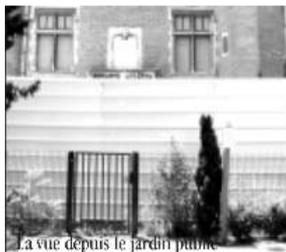
La vue depuis le jardin public

escroquerie montée par un architecte bordelais, Philippe Tilliet. Sous couvert d'« investissements défiscalisants », ce dernier a vendu les monuments par lots à des centaines d'investisseurs privés qui finançaient le foncier mais surtout les travaux, très conséquents, pour