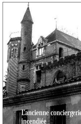
L'ancienne conciergerie incendiée