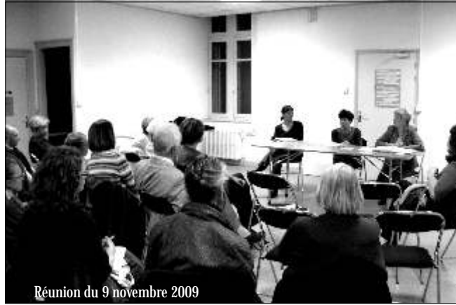
Réunion du 9 novembre 2009

d'Estaing. En 1982, Mme Roudy devient la première ministre des droits de la femme. En 1992, la violence conjugale est reconnue comme un délit et enfin, en 2000, est votée la loi sur la parité. L'égalité entre hommes et femmes est un principe reconnu dans la constitution européenne.