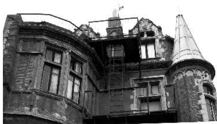
Derrière la clôture en palplanches, rambardes et escaliers du Lycée

1937. Pendant la guerre, elles y hébergèrent des familles de réfugiés, tandis que des tranchées étaient creusées dans le parc. Les sœurs en firent un centre d'apprentissage de la couture pour jeunes filles sans emploi. Par mesure de sécurité et de fonctionnalité, de nombreux vitraux furent déposés, tandis que les peintures de Bénézet étaient revêtues d'un badigeon. Les sœurs vendirent le château en 1956 à l'État, qui en fit un lycée professionnel... auquel nous devons les ajouts de rampes de fer et escaliers extérieurs qui détériorent les façades. La Ville de Toulouse racheta la Maison des Verrières en 1987. De 1987 à 1992, le château connut une période faste, occupé en partie par la classe d'orgue du Conservatoire national de Musique, dirigée par Xavier Darasse, et l'Association des Arts renaissants. C'est au cours de cette période que le château fut inscrit à l'inventaire, puis classé monument historique (1991). Xavier