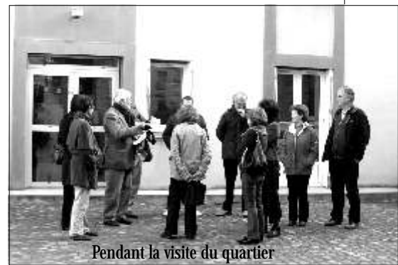
Pendant la visite du quartier